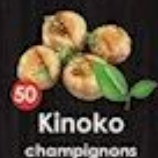
50 Kinoko champignons