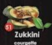
51 Zucchini courgette