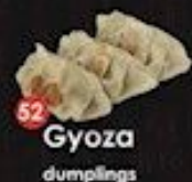
52 Gyoza dumplings